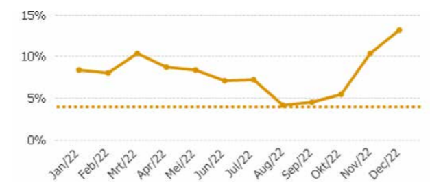
Figuur 1: Verzuimpercentage 2022 (8,0%)

Het verzuim in 2022 was 8%. De verzuimfrequentie was 1,4 (gemiddeld aantal meldingen per medewerker). In totaal waren er 166 verzuimmeldingen.